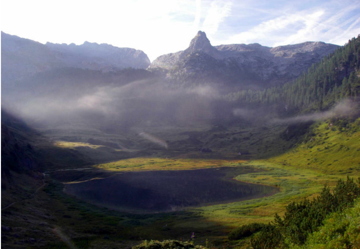
Morgenstimmung am Funtensee

Wünsche Euch allen, auch wenn Ihr bei meinen Angeboten nicht dabei sein könnt, einen schönen, sonnigen und naturzauberhaften Bergsommer! Mädesüßduftende Grüße aus dem Leopoldstal vom Od*Chi