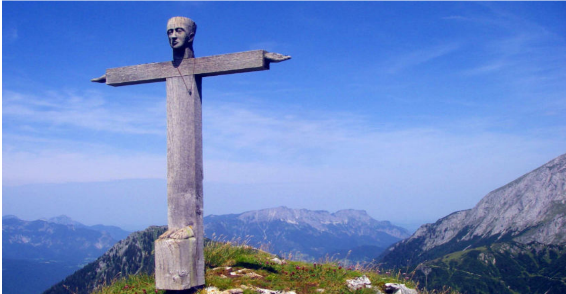
Das ungewöhnliche Gipfelkreuz auf der Rotspielscheibe, im Hintergrund der Untersberg

Am Sonntag, 21. Juli soll mal wieder eine Naturzauber~Bergwanderung auf die schöne Rotspielscheibe im Hagengebirge stattfinden, die zu dieser Zeit eine unglaubliche Blütenpracht zu bieten hat. Sogar Arnika ist dort in üppigen Ausmaßen zu sehen. Wer daran interessiert ist melde sich bitte bis spätestens Freitag, 19. Juli ~ 21 Uhr übers Anmeldeformular www.naturzauber.org/pages/anmeldung/anmeldung-bergwanderung.php an. Weitere Infos zur Tour inkl. Touren~ und Ortsbeschreibung auf www.urwurz.de/2072.0.html Würde mich sehr freuen, wenn die Tour zu Stande käme und wir diesen Blütenzauber gemeinsam bewundern dürften!