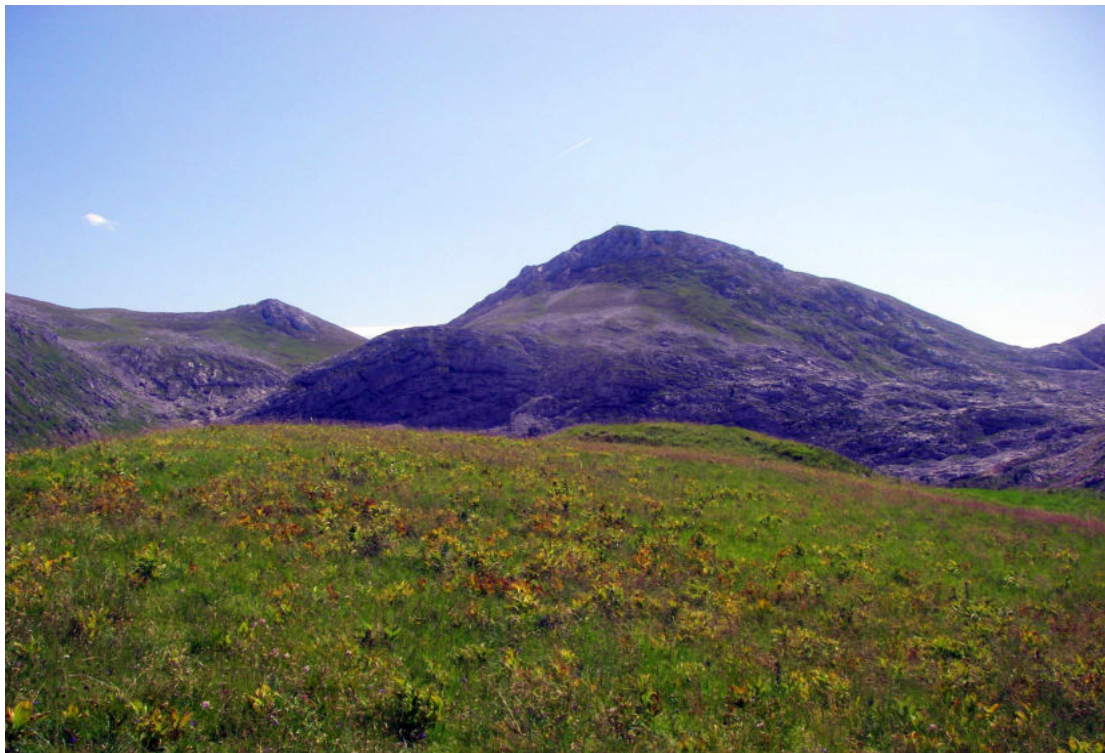
Gipfelwiese der Rotspielscheibe mit Windschartenkopf