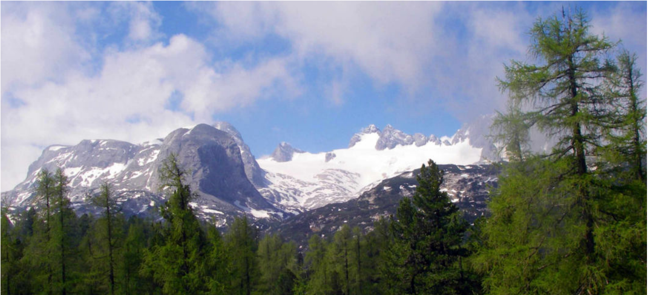
Auf dem Dachsteinplateau

Liebe Freundinnen und Freunde der naturzauberhaften Gourmet~Bergwanderungen!