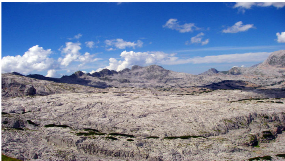
Mitten im Steinernen Meer

Noch EINEN PLATZ FREI hätte ich für die 5 Tageswanderung durchs Steinerne Meer vom 26. bis 30. August mit 4 Hüttenübernachtungen. Das heißt, für eine Person wären die Übernachtungsplätze gesichert. Sofern dieser Platz vergeben ist, besteht natürlich schon auch noch die Möglichkeit dabei zu sein, dann müssten jedoch die Übernachtungsplätze selbstständig reserviert werden und nur wenn diese bestätigt sind, kann an der gesamten Tour teilgenommen werden. Natürlich wäre es auch möglich, nur einen Teil mit zuwandern, dann müsste aber der spätere Zustieg oder frühere Abstieg allein unternommen werden. Ja, es würde mich freuen, wenn sich zumindest noch eine Teilnehmer*in findet und ich den reservierten Platz nicht absagen müsste.