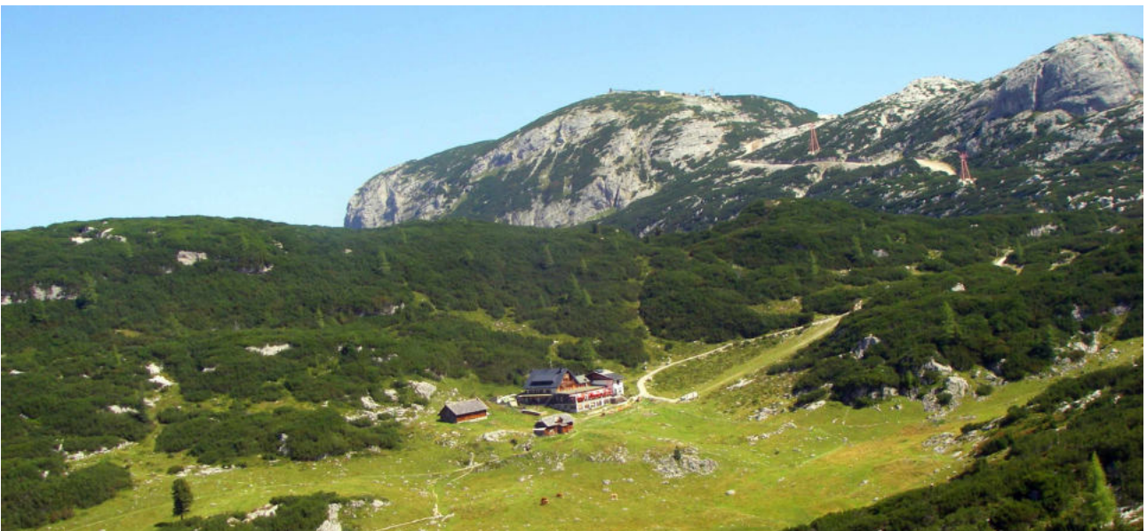
Auf der Gjaidalm

Weitere Infos dazu auf www.urwurz.de/1934.0.html